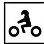
EN 1621-2 Pictogramme moto Cousu à l'intérieur De la dorsale.