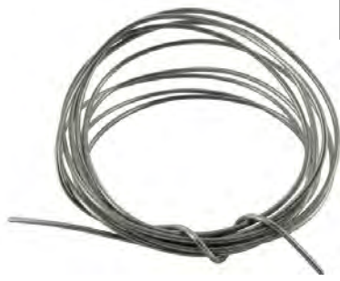
Fil à freiner inox (env. 0.8mm)