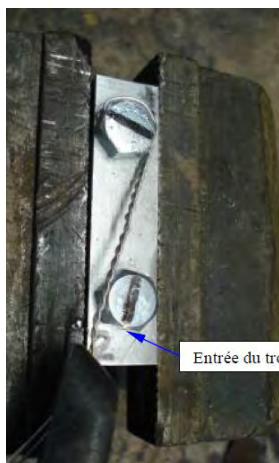
Entrée du trou vis n° 2

Etape 4 : Torsade. On serre les 2 fils à l'aide de la pince à freiner, de telle sorte que la pince, les 2 fils et le trou de tête de vis soient alignés. La pince est verrouillée, puis on tire sur le bouton moleté pour faire tourner la pince et réaliser ainsi une première torsade.